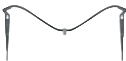
Conjunto de 2 salidas