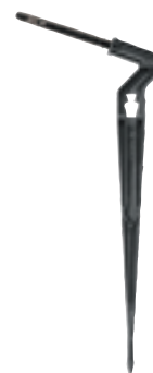
Estaca a laberinto acodada