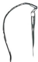
Conjunto de 1 salida